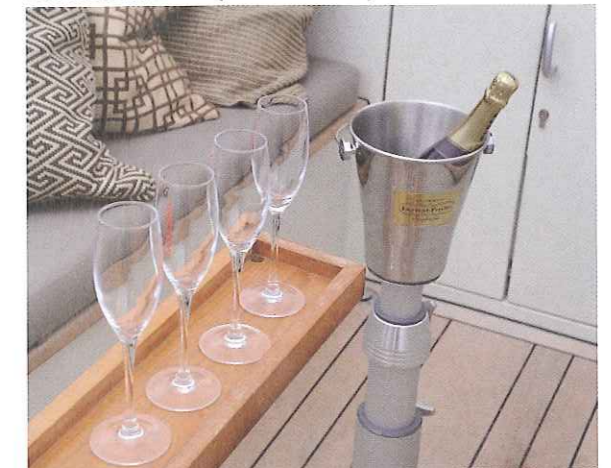
Zet de champagne maar koud, want dat wordt genieten.