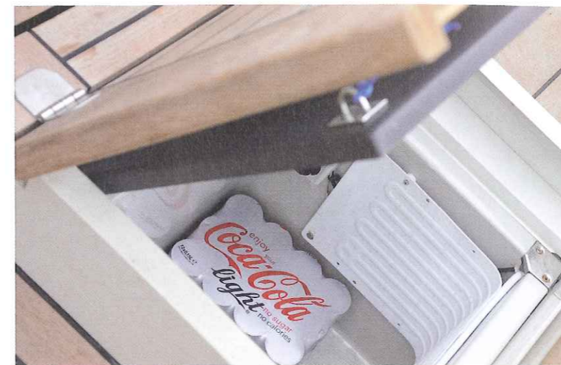
In de vloer is een koelkast ingebouwd.

als bestuurder even een treetje hoger staan en je hebt over de menigte heen toch goed uitzicht en je kunt nog steeds het stuurwiel bedienen". De Woest is een zeer praktische boot, die juist door gebruik te maken van Basic materialen zijn bijzondere stoere uitstraling kreeg. Die aparte uitstraling begint al aan de buitenzijde waar een stoere houten plank, die midden over het casco loopt, dient als stootplank bij het aanleggen in de haven. Bijzonder zijn ook de twee boeglichten voorin het front. Verder wordt hij geleverd met buiskap, zodat u ook bij minder weer kunt gaan varen. Ook is de Woest geschikt om een nachtje over te blijven. Want het zonnedek achterin is groot genoeg om 4 mensen te laten slapen. Ook beschikt hij over een fantastische geluidinstallatie. Want zodra men de kussenset van het zonnedek verwijdert, ontstaat een riante dansvloer. Zo is de Woest ook te gebruiken als "feestbeest". Onder de vloer zijn naast voldoende bergruimte, twee koelkasten weggewerkt en kan de smalle tafel in het voorste gedeelte worden vervangen door een groot tafelblad. Interieur en vloeren zijn volledig van teak uitgerust met toilet, spoelbak, dekwass, douche, slaapplekken en JBL soundsystem. De Woest is een onderhoudsarme en zelflozende sloep. De romp is gebouwd door Freddie Bloemsmas aluminiumbouw en de afbouw is verzorgd door Claasen Jachtbouw. Het ontwerp is van deVosdeVries design.