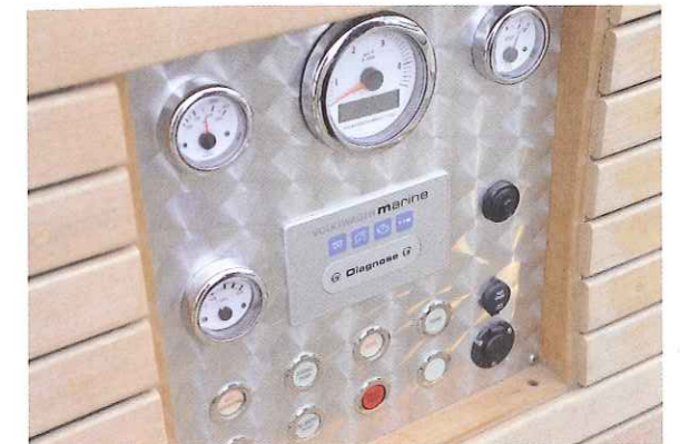
Het instrumentenspaneel in de zijkant van de boot.