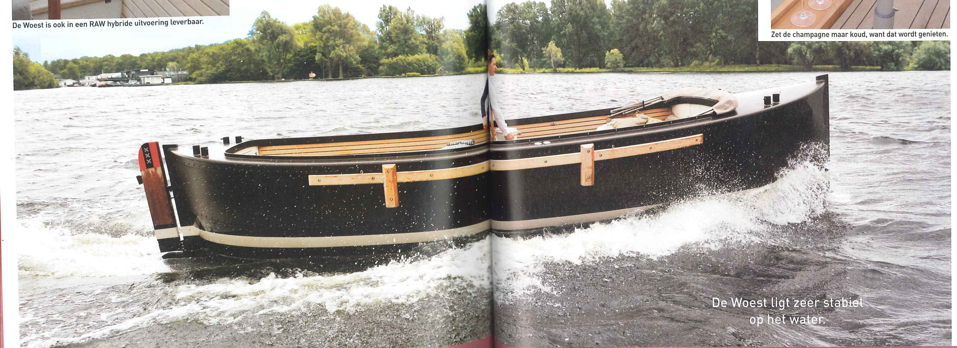
De Woest ligt zeer stabiel op het water.