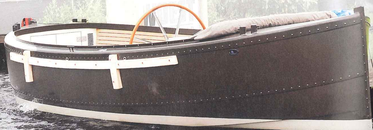
De Woest is een onderhoudsvriendelijke aluminium sloep.